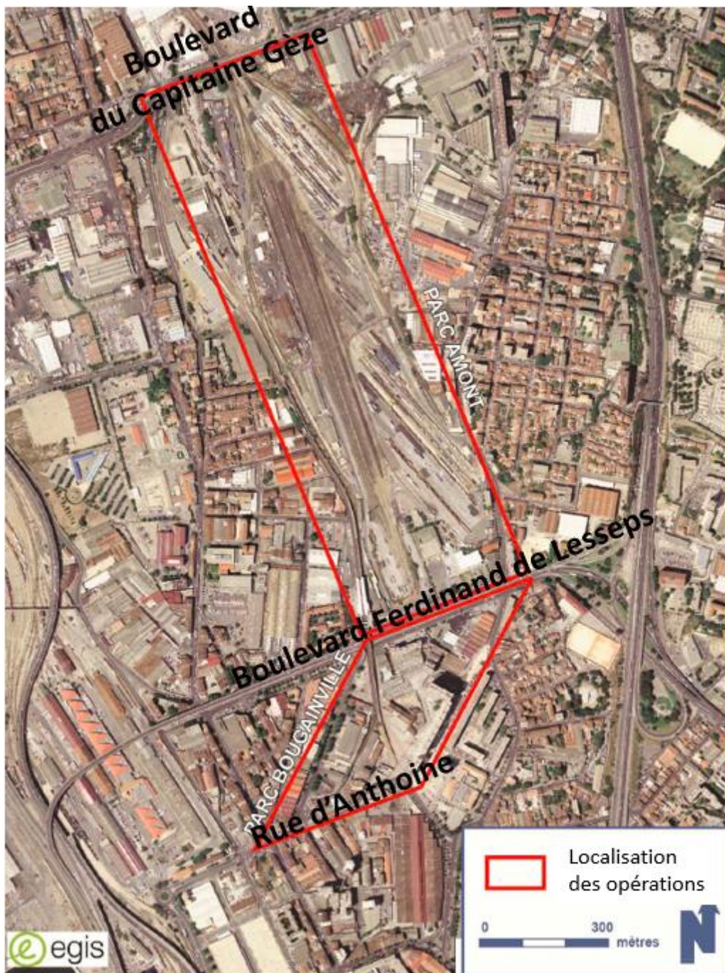
Localisation des zones d'études pour les deux phases du parc des Aygalades (carte issue d'une étude de la société EGIS)